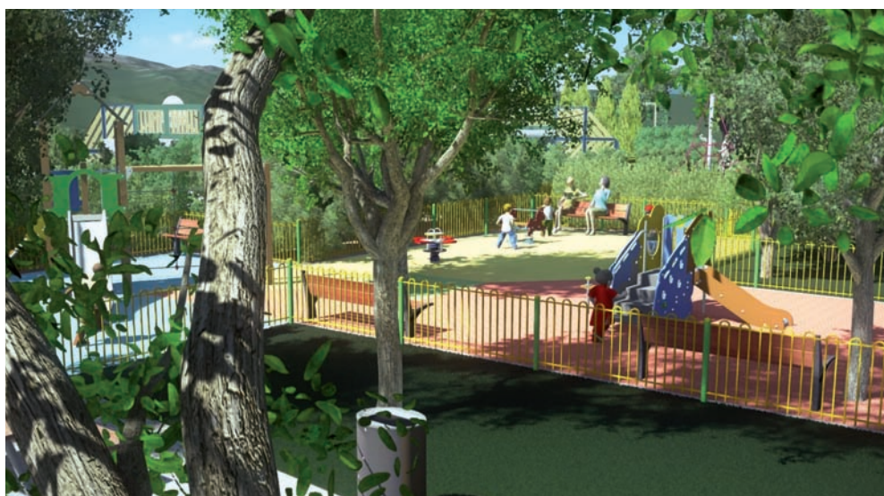
Illustration du projet de réaménagement de l'aire de jeux

de regroupement des bacs, source d'inconvénients quotidiens comme de nombreux dépôts sauvages, des mauvaises odeurs et une intégration paysagère pas vraiment esthétique. Cette aire sera remplacée par un espace réservé aux poubelles des logements individuels et par une autre destinée au transit des conteneurs des logements collectifs. Ces derniers ne resteront sur l'espace public que le temps du ramassage, charge au personnel des immeubles gérés par les bailleurs de procéder à leur déplacement. Outre les améliorations de stationnement que cela engendrera sur la zone, la solution retenue permettra de créer de nouveaux massifs de plantes vivaces et d'arbustes à fleurs. Les manœuvres des camions de la Métro seront elles aussi rendues plus aisées. Les travaux, que les habitants souhaiteraient grandement voir commencer avant la fin de l'année sont pour l'heure chiffrés autour de 170 000 euros.