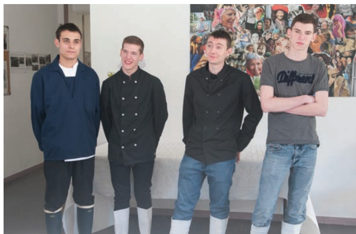
Les quatre lauréats du concours des meilleurs apprentis de France.

C'est à l'ENILV (École nationale des industries du lait et de la viande) de Pont de Claix qu'a eu lieu le concours des meilleurs apprentis de France (sélection régionale) dans la catégorie Poissonnerie.