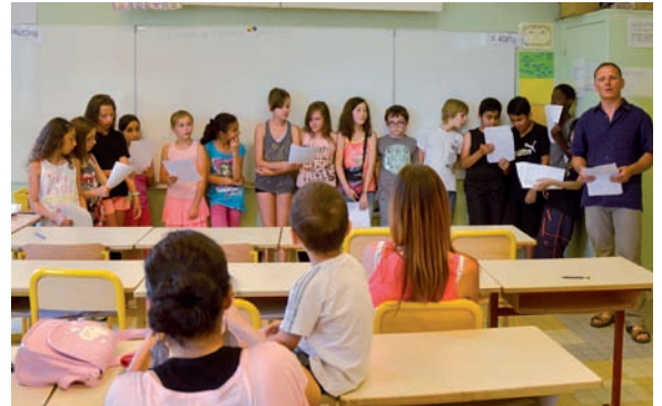
Le parcours dans la ville conçu et réalisé par les enfants a été présenté aux parents et partenaires le 2 juillet

Pour clore le projet, des 6 e du collège Moucherotte ayant eu la même démarche sur le nord de la commune ont testé le parcours des CM 2 et inversement, avant l'impression du document final qui sera mis à disposition à l'accueil de la mairie pour les nouveaux habitants ou tout Pontois curieux de visiter sa commune autrement.