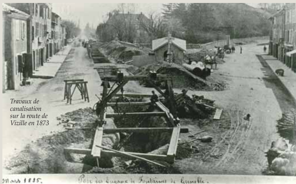
Travaux de canalisation sur la route de Vizille en 1873

(1) le bureau d'étude qui a conçu le projet est le maître d'œuvre : le maître d'œuvre est un prestataire, personne physique ou morale, qui, pour sa compétence technique, est chargé par le maître de l'ouvrage (la ville) de diriger et de contrôler l'exécution des travaux et de proposer au maître de l'ouvrage leur réception, de vérifier la facturation de l'entreprise... Une fois le programme et l'équipe définis, les phases suivantes se déclinent selon la loi sur le Maîtrise d'Ouvrage Publique sur plus d'un an : études d'avant-projet : 3 mois en fonction de la taille du projet • études de projet : 3 mois en fonction de la taille du projet • élaboration du dossier de consultation des entreprises : 2 mois • procédure de lancement de consultation des entreprises (marchés de travaux sur appel d'offres) et désignation des lauréats : 6 à 8 mois • engagement financier et notifications des marchés : 2 mois.