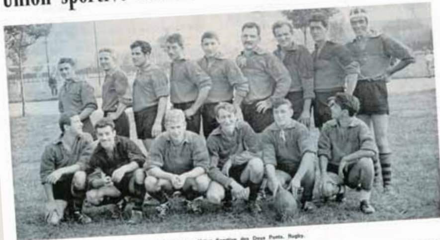
Équipe fanion, Union Sportive des Deux Ponts, Rugby.

L.U.S.P. a été créée en 1904 pour pratiquer le rugby, sport presque inconnu dans notre région. Son siège est à la mairie de Pont-de-Claix. En 1912, une section gymnastique fut adjointe. Cette société groupait à cette époque tous les sportifs de la commune. Son premier palmarès fut : sous-champion des Alpes en 1908. En pleine évolution depuis cette date, elle dut se mettre en sommeil pendant la grande guerre de 1914-1918. Elle reprit ses activités après cette dure épreuve jusqu'en 1930.