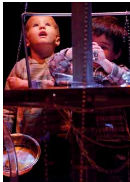
Spectacle jeune public à l'Amphithéâtre, du 20 au 22 mars. Tél. : 04 76 99 83 77