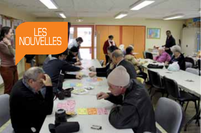
Loto à Beau site dans le cadre du Café social