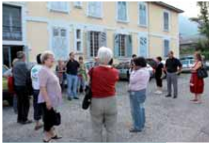
Juin 2012, visite de la future maison des associations

Depuis 2008, L'avant-projet d'une maison pour loger les associations a été présenté aux habitants et associations de Pont-de-Claix lors de réunions publiques. Un groupe de travail regroupant asso-