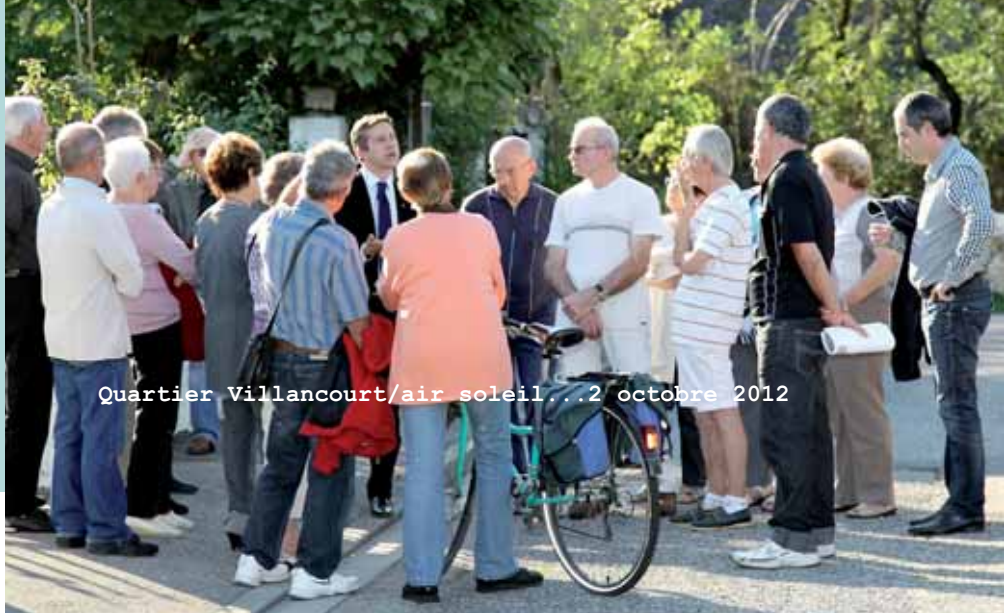
Quartier Villancourt/air soleil... 2 octobre 2012

engagent le débat sans obstacle, « de vive voix », souvent de façon constructive. Cela permet de donner à chacun et à tous, au-delà des acteurs habituellement mobilisés, l'occasion de prendre la parole sur les enjeux collectifs. La construction collective de propositions d'intérêt général est le but poursuivi, qu'il faut prévenir contre la tentation que pourraient avoir certains groupes ou groupement d'exercer des pressions à leur propre et unique profit.