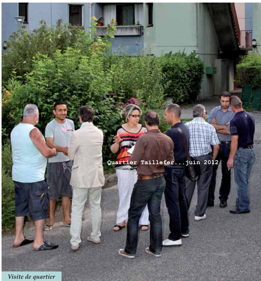
Quartier Taillefer... juin 2012

« LE GOUVERNEMENT DU PEUPLE, PAR LE PEUPLE ET POUR LE PEUPLE »,