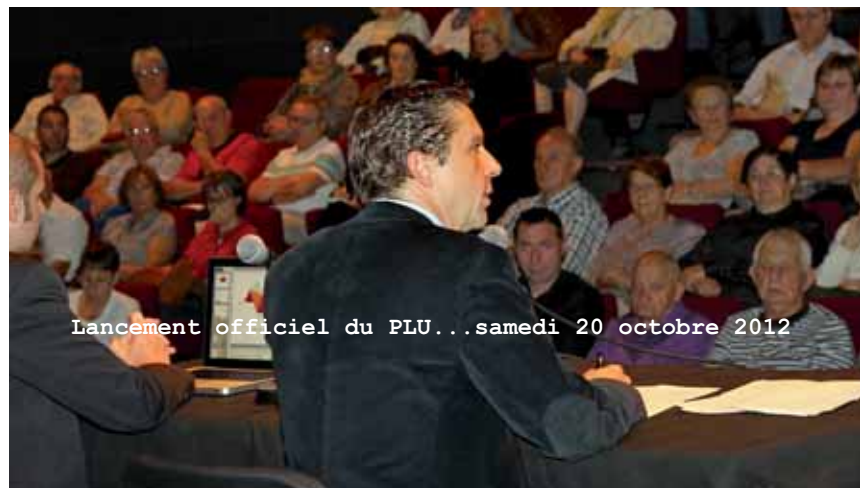
Lancement officiel du PLU...samedi 20 octobre 2012

régionale (RNR) des Isles du Drac ; avec Le syndicat mixte des transports en commun (SMTC) le déplacement du terminus du tram A jusqu'à Flottibulle « c'est pour demain » précise le maire. Enfin La Métro ne saurait être insensible aux projets de développement économiques, notamment du secteur sud et vient d'être interpellée