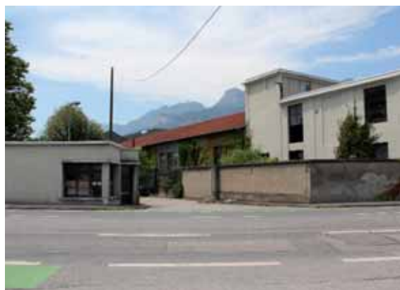
L'entrée des anciennes papeteries de Pont de Claix

Lequel passe par la requalification du site des papeteries : le secteur, écrit Christophe Ferrari « dispose d'un potentiel important avec plusieurs espaces