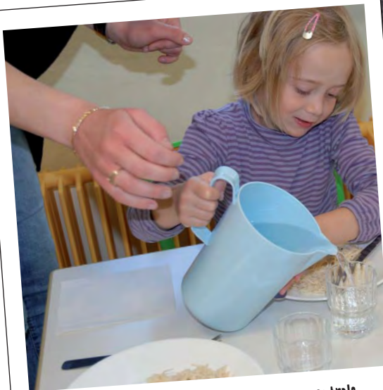
Le goût d'un repas fabriqué à la cuisine centrale s'élève à 6,97 euros environ : en fonction de leur quotient familial les familles y contribuent de 2,10 à 6,10 euros.

La préparation des repas, l'élaboration des menus, ainsi que le service dans les cantines sont assurés par la cuisine centrale et par le personnel communal. 20 à 25 % de produits bio sont régulièrement introduits dans les repas préparés à la cuisine centrale.