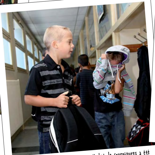
Le crédit accordé aux classes pour l'achat de fournitures a été augmenté pour la première fois depuis 4 ans : il est passé de 29 à 31 euros par élève.