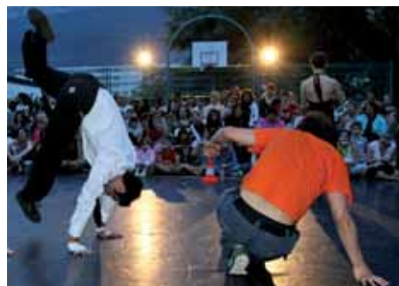
Les 50 ans de la Compagnie de Chauffage ont été marqués en 2010 par une prestation d'artistes dans le quartier des Iles de Mars