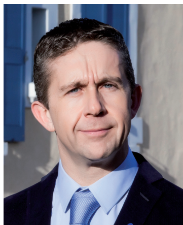
● Christophe Ferrari Maire de Pont de Claix Président de Grenoble-Alpes Métropole