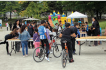
Fête de quartier

Il se réunira de manière autonome et décidera de la périodicité des rencontres (par exemple : au minimum une fois par trimestre, plus si nécessaire).